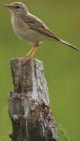
L'abtuška poľná ( Anthus campestris )

Najmenej nápadným druhom, pre ktorý bolo CHVÚ Dolné Považie vyhlásené, je l'abtuška poľná ( Anthus campestris ), drobný spevavec viazaný na suché a teplé stanovišťa s nízkou vegetáciou.