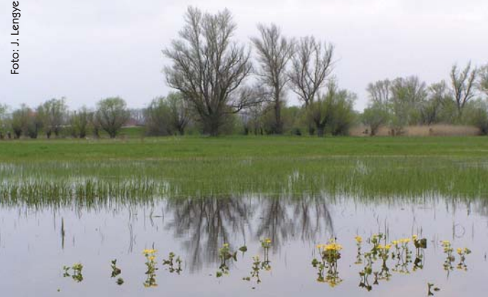
Samica kane močiarnej na hniezde s mláďatami

Ako už názov tohto vtáčieho druhu napovedá, kaňa močiarna je dravec, ktorý je viazaný na mokrade. Obýva predovšetkým nížinnú krajinu. Na relatívne malej ploche CHVÚ Dolné Považie je viazaná na posledné fragmenty mokradných biotopov, vyhľadáva miesta so stojatou alebo pomaly tečúcou vodou, porasty trste, pálky alebo slaniská. Hlavnou potravou kane močiarnej sú drobné zemné hlodavce a mláďatá menších druhov vtákov, ktoré loví v širšom okolí. Menej preferuje hmyz, obojživelníky, plazy a ryby. V latinčine má príznačné meno – „ Circus “ čo v slovenčine znamená kruh – podľa spôsobu, akým lieta a loví. Poletuje nízko ponad trstím alebo obilím, hľadajúc potravu. Veľmi často krúži nad loviskami. V češtine ju podľa jej charakteristického letu nazvali ešte výstižnejšie „moták“.