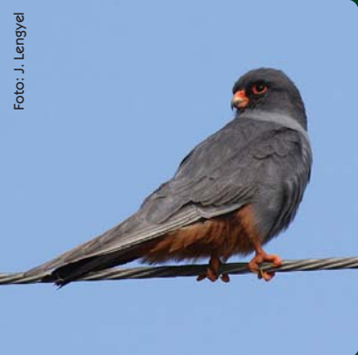
Sokol červenonohý – samec (dolu) a samica (hore)

Tento drobný, verejnosti takmer neznámy sokol, patrí k najmenším dravcom Európy. Najviac pripomína sokola myšiara ( Falco tinnunculus ), najbežnejšieho dravca miest a poľnohospodárskej krajiny. Sokol červenonohý je však odlišne sfarbený. Pre druh je charakteristický pohlavný dimorfizmus. Samec má, tak ako jeho názov napovedá, nápadné oranžovo-červené nohy, ozobie a okolie oka, ktoré sú v kontraste s bridlicovosivým telom. Samica pôsobí na pohľad pestršie ako samec, má však modrošedý chrbát, oranžovú spodinu tela a belavo sfarbené strany hlavy. Ozobie a nohy sú menej výrazne sfarbené ako u samca.