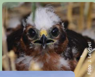
Kaňa popolavá ( Circus pygargus )