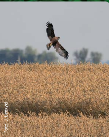
V poľnohospodárskej krajine hniezdi kaňa močiarna aj v obilných poliach.