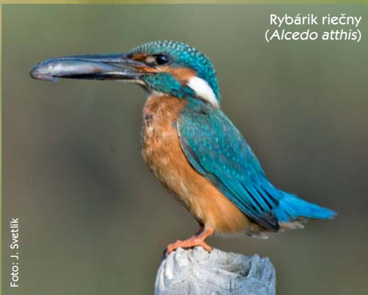
Rybárik riečny ( Alcedo atthis )

Fragmenty lužných lesov, remízky a solitérne stromy vyhľadáva aj d'ateľ hnedkavý ( Dendrocopos syriacus ). Tento teplomilný druh, blízko príbuzný nášmu známejšiemu d'ateľovi veľkému ( Dendrocopos major ) dosahuje na Slovensku svoju južnú hranicu rozšírenia.