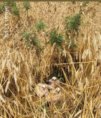
Hniezdo kane popolavej v obilí

Dolné Považie je jedným z troch najvýznamnejších území na Slovensku pre hniezdenie kane močiarnej ( Circus aeruginosus ) a pravidelne tu hniezdi viac ako 1% národnej populácie sokola červenonohého ( Falco vespertinus ).