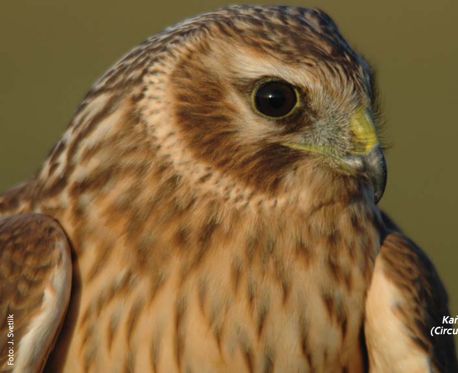
Kaňa popolavá ( Circus pygargus )

Z ďalších významných druhov dravcov v CHVÚ hniezdi aj kaňa popolavá ( Circus pygargus ).