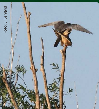
Pár kopuluje najmä na vyvýšených miestach

Najvhodnejším prostredím pre sokola červenonohého sú stepné oblasti s rozsiahlymi nížinnými pasienkami, s dostatkom veľkých druhov hmyzu, ktorý je jeho hlavnou potravou. Uprednostňuje rôzne druhy kobyliek, koníkov, krtonôžok, svrčkov alebo chrobákov.