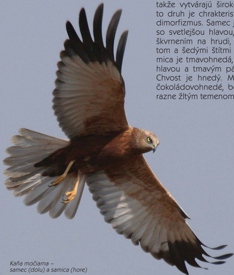
Kaňa močiarna – samec (dolu) a samica (hore)

Kaňa močiarna sa na prvý pohľad podobá na myšiaka lesného ( Buteo buteo ), je však štíhlejšia a krídla pri krúžení dvíha vyššie nad chrbát, takže vytvárajú široké „V“. Pre tento druh je charakteristický pohlavný dimorfizmus. Samec je tmavohnedý so svetlejšou hlavou, s pozdĺžnym škvrnením na hrudi, šedým chvostom a šedými štípmi v krídlach. Samica je tmavohnedá, so svetložltou hlavou a tmavým pásom cez oko. Chvost je hnedý. Mladé vtáky sú čokoládovhnedé, bez škvŕn, s výrazne žltým temenom a šijou.