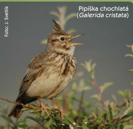
Pipíška chochlatá ( Galerida cristata )

V zmysle vyhlášky Ministerstva životného prostredia Slovenskej republiky č. 593/2006 Z. z., ktorou sa vyhlasuje CHVÚ Dolné Považie na ploche o výmere 31 195,5 ha a ktorá nadobudla účinnosť 15.11.2006, sú predmetom ochrany nasledujúce druhy vtákov: sokol červenonohý, kaňa močiarna, ďateľ hnedkavý, krakľa belasá, ľabtuška poľná, penica jarabá, pipíška chochlatá, prepelica poľná, prhľaviar čiernohlavý, rybárik riečny a strakoš kolesár.